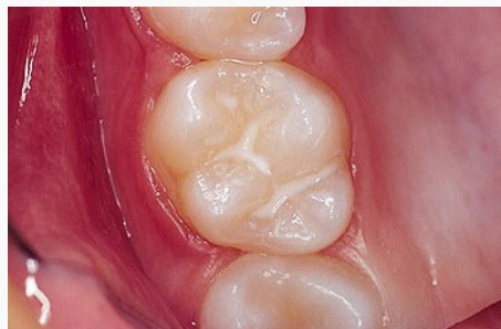
Schutz vor Karies: Versiegelung der feinen Grübchen auf der Kaufläche

Bei der Versiegelung werden die Fissuren mit einem hellen Kunststoff dauerhaft verschlossen, so dass an diesen Stellen keine Karies mehr entstehen kann (siehe Abb. unten).